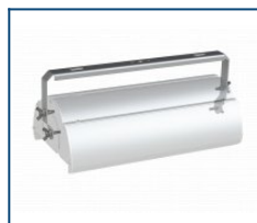
Кронштейн лира Angar 90 (комплект)